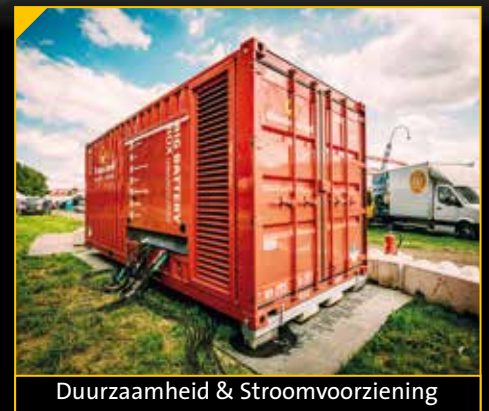
Duurzaamheid & Stroomvoorziening