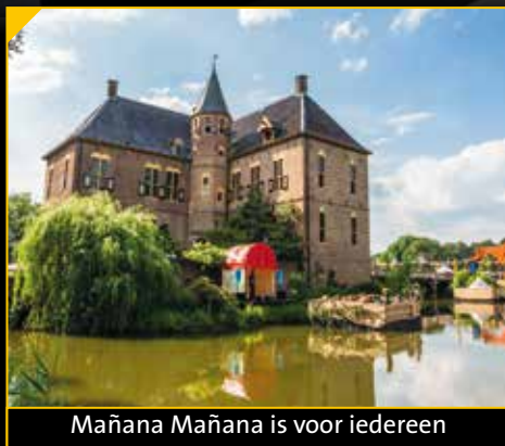
Mañana Mañana is voor iedereen