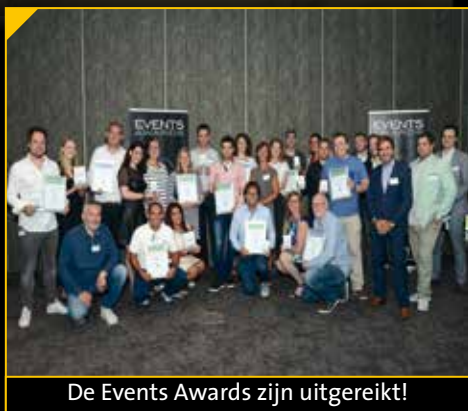
De Events Awards zijn uitgereikt!